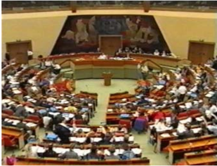
Bild 1. Inledande plenarmöte

presenterade. I vårt kloningsexempel har vi sex intressegrupper. Om klassen består av 30 elever, så skall man ha 5 elever i varje grupp.