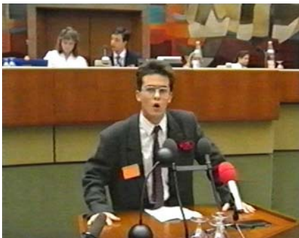
Bild 3. Andra plenarmötet

4. Bestäm vilken intressegrupp som varje elevgrupp skall föreställa – låt dem inte själva välja (se ovan)! Mitt råd är att inte fördela eleverna så att du har en blandning av aktiva och passiva elever i varje grupp – om du vill fördela dem på något speciellt sätt, så bilda grupper av passiva respektive grupper av aktiva elever. (De passiva blir aktiva förvånande snabbt!). Ge de "passiva" grupperna roller som extremister och de "aktiva" som konservativa.