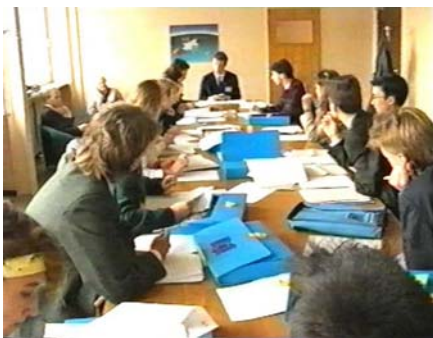
Bild 2. Kommittémöte