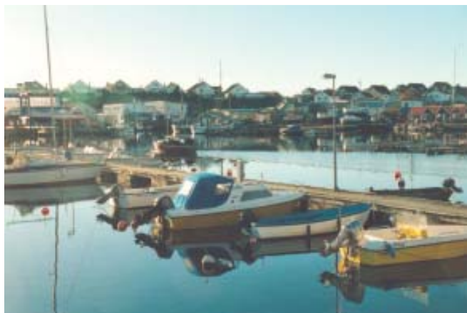
Figur 3. Småbåtshamnar brukar vara bra utsättningsplatser för racken.

Att tänka på innan och när du sätter ut racken Kanske det viktigaste är att ha en frågeställning klar innan försöket påbörjas. Vad är det som skall undersökas? Kanske vill du bara studera djur- och växtlivet på en viss plats eller göra en mer komplicerad undersökning med jämförelser av olika miljöer? Hur skall vi utföra försöket för att få svar på vår frågeställning?