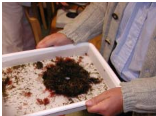
Figur 4. Virtue-platta klar att undersöka.

om större organismer eller när man t.ex. vill studera kiselalger, som dominerar vintertid, och encelliga djur.