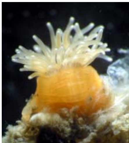
Figur 1. Havsanemon.