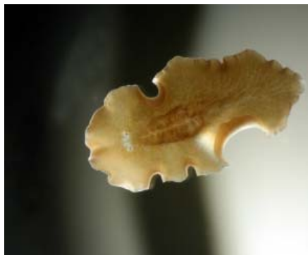
Figur 2. Plattmask.

VIRTUE-projektets påväxtförsök ger rika möjligheter till ett undersökande arbetssätt, övning i att utforma experiment, genomföra mätningar i fält, tolka och redovisa resultat. Eleverna får insikt i begreppet biologisk mångfald och får inblick i organismernas systematik och deras samspel i olika ekosystem. Försöken visar på ett enkelt sätt hur ekosystem förändras med tiden. Elevernas egna observationer gör det lättare för dem att se sambanden mellan iakttagelser och teoretiska modeller. Undersökningarna leder på ett naturligt sätt till samarbete mellan olika ämnen och passar därmed utmärkt som temaarbete. Projektet passar också väl för lärarsamverkan, både inom och mellan skolor. Påväxtförsöken går att utföra i alla slags vatten men ju saltare vattnet är, desto fler arter finner man på plattorna och organismerna är också större. För att studera påväxten räcker det i allmänhet med att man använder en stereolupp med 20–40 ggr förstoring. Större organismer som t.ex. blåmusslor kan naturligtvis studeras utan några som helst hjälpmedel. Ibland krävs mikroskop med minst 60 ggr förstoring. Detta gäller särskilt om plattorna tas upp efter kort tid och speciellt om de hängt i sötvatten. Genomskinliga CD-skivor skickas till skolan utan kostnad (se nedan) och materialet till anordningen skivorna sitter på (racket) kostar ca.15 kr. Själva racken kan med fördel tillverkas av eleverna, som då får träning i att läsa ritningar.